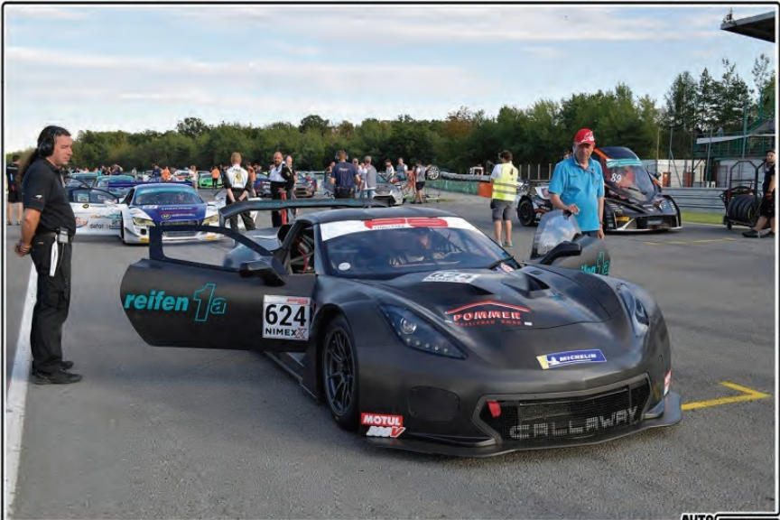
P9 Challenge/SCC/FIA Zone, Masaryk Racing Days, Brno, 4.-6.9.2020