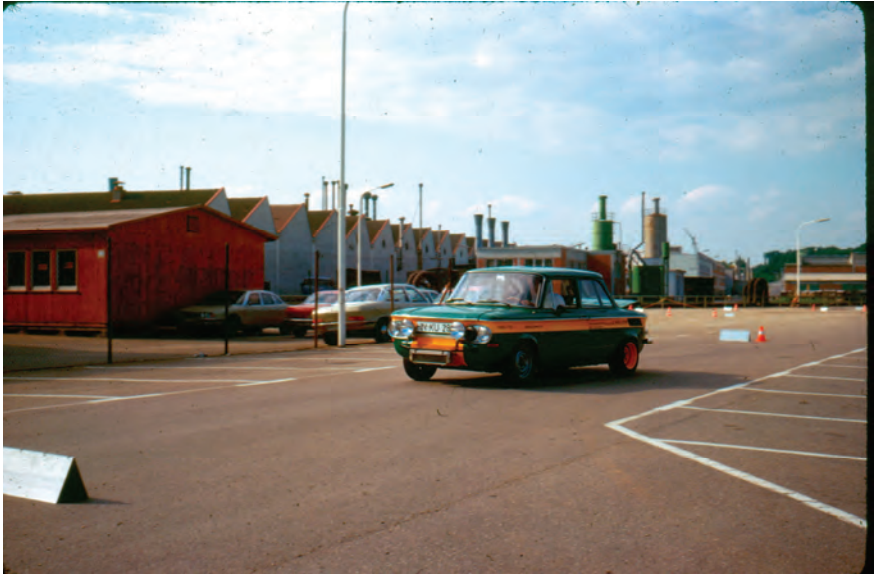
Gerd Walter beim MCH Slalom 1971

Wird er durchgeführt oder wird er nicht??